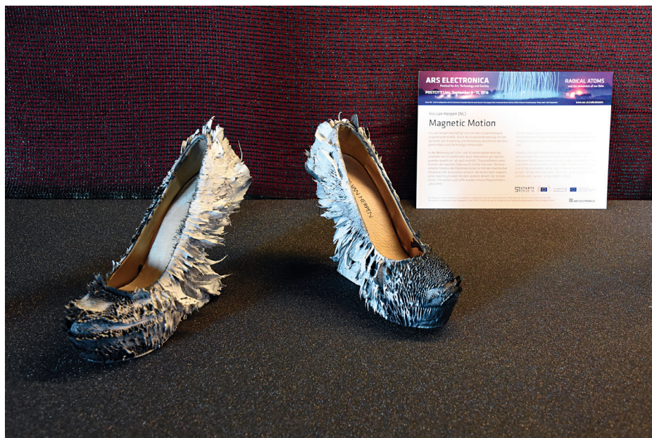
Iris van Herpen (NL) a časť projektu Magnetic Motion oceneného cenou Starts Prize 2016

Medzi nominovanými a ocenenými projektmi boli mnohé niekdajšie sny dávnych