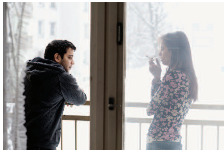
Cesta ven (r. P. Václav; CZ,FR; 2014), otvárací film Minifestivalu európskeho filmu 7x7

> V spolupráci s európskou sieťou dokumentaristov European Documentary Network (EDN), MFF Cinematik Piešťany a s finančnou podporou Audiovizuálneho fondu sme organizovali seminár a workshop, zameraný na fázu vývoja dokumentárnych filmov DOX IN VITRO (predtým pod názvom Koprodukovanie dokumentárnych filmov v Európe), ktorý sa uskutočnil 8. a 9. septembra 2015 v piešťanskom Kursalone počas 10. ročníka MFF Cinematik Piešťany. Podujatie