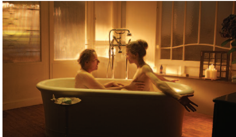
1001 Gram (r. B. Hamer; NO, DE; 2014), Výberová podpora kinodistribúcie, Film Europe