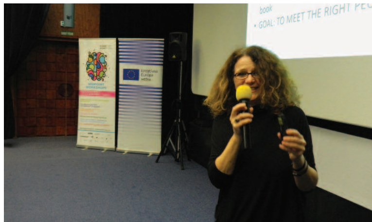
Filmový projekt pre medzinárodný trh