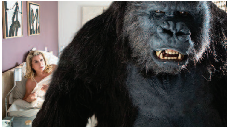
Le tout nouveau testament (r. J. Van Dormael; BE, FR, LU; 2015), Výberová podpora kinodistribúcie, ASFK

chvíľu (kuriozitou je napríklad produkčná spoločnosť, ktorá začala vypíňať formuláre podpory vývoja ráno v deň uzávierky), pričom považujú podporu z podprogramu MEDIA za doplnkové financovanie. V niektorých prípadoch (hlavne v schéme podpory vývoja projektov a pokiaľ sme mali možnosť do nich nahliadnuť) je príčinou pomerne nízka umelecká kvalita projektov a tiež častou príčinou je zlý odhad stupňa pripravenosti projektu vstúpiť do celoeurópskej súťaže, čo v skutočnosti MEDIA je. Je treba si uvedomiť, že podpora MEDIA nie je podpora tvorby, ale priemyslu. Rovnako podrobne sa posudzuje samotný projekt, ako i spoločnosť, ktorá ho predkladá a nemenej dôležitým faktorom je európska dimenzia projektu. Teší nás, že schopnosť spoločností nájsť si medzinárodných partnerov sa zvyšuje, čoraz viac projektov vzniká v medzinárodnej spolupráci.