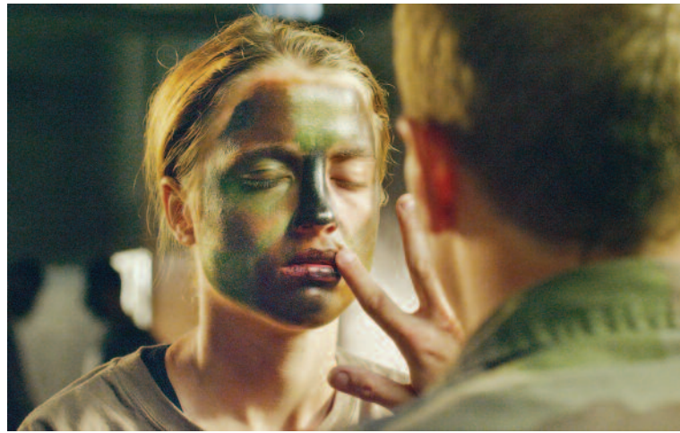
Les combattants (r. T. Caillay; FR; 2014), Výberová podpora kinodistribúcie, Film Europe

Vzhľadom na to, že kancelária Creative Europe Desk nemajú k dispozícii kompletné relevantné údaje, môžeme konštatovať iba všeobecne, že úspešnými sú spoločnosti, ktoré všetkým požiadavkám, čo kladie podprogram MEDIA na predkladané projekty a na príslušné náležitosti formulárov, venujú dostatočný čas, pozornosť a energiu. Neúspech pri posudzovaní žiadostí vyplýva najčastejšie z toho, že spoločnosti predkladajú svoje žiadosti v časovom strese, na poslednú