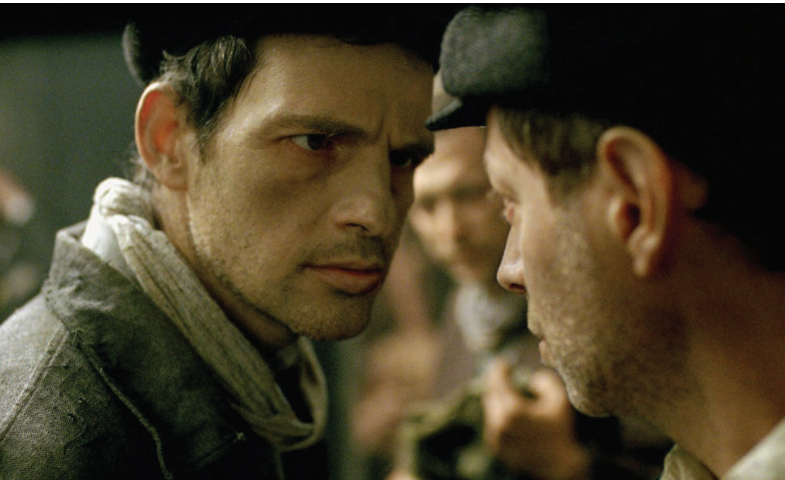
Saul fia (r. L. Nemes; HU; 2015), Výberová podpora kinodistribúcie, Film Europe