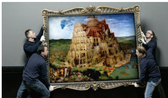
Das große Museum (r. J. Holzhausen; AT; 2014), Výberová podpora kinodistribúcie, Film Europe