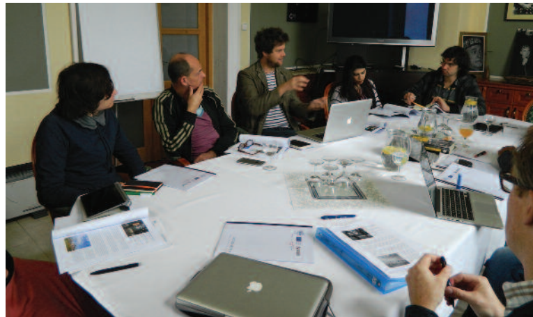
DOX IN VITRO

> Počas dní 8. – 9. decembra 2015 sme spoluorganizovali medzinárodnú konferenciu Kultúra a mesto: sila príťažlivosti . Cieľom bolo kriticky preskúmať aktuálne možnosti, vzťahy a otvorené otázky o význame kultúry pre rozvoj súčasného európskeho mesta. Hlavným organizátorom bolo združenie A4 – asociácia združení pre súčasnú kultúru. Snahou bolo tiež prispieť k diskusii o budúcnosti Európy prostredníctvom preskúmania prínosov kultúrneho plánovania a tvorby kultúrnych