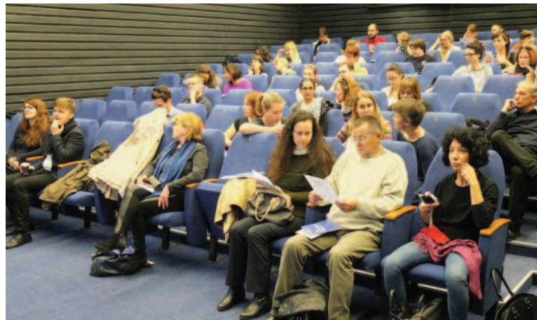
Informačné stretnutie Európske výzvy