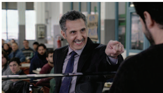
Mia madre (r. N. Moretti; IT, FR; 2015), Výberová podpora kinodistribúcie, Film Europe