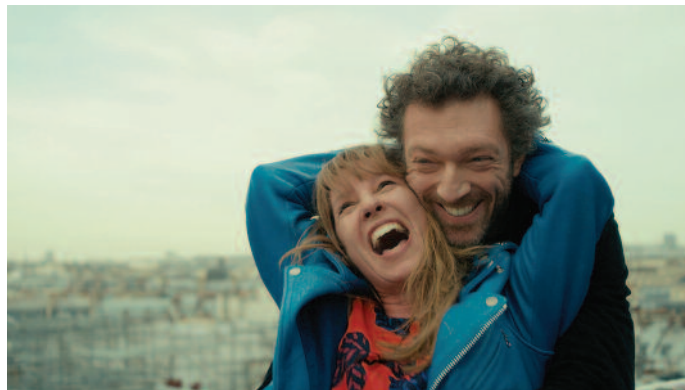
Mon Roi (r. Mäiwenn; FR; 2015), Výberová podpora kinodistribúcie, Film Europe