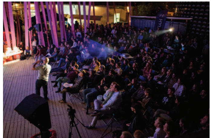
Fest Anča 2015, Podpora filmových festivalov