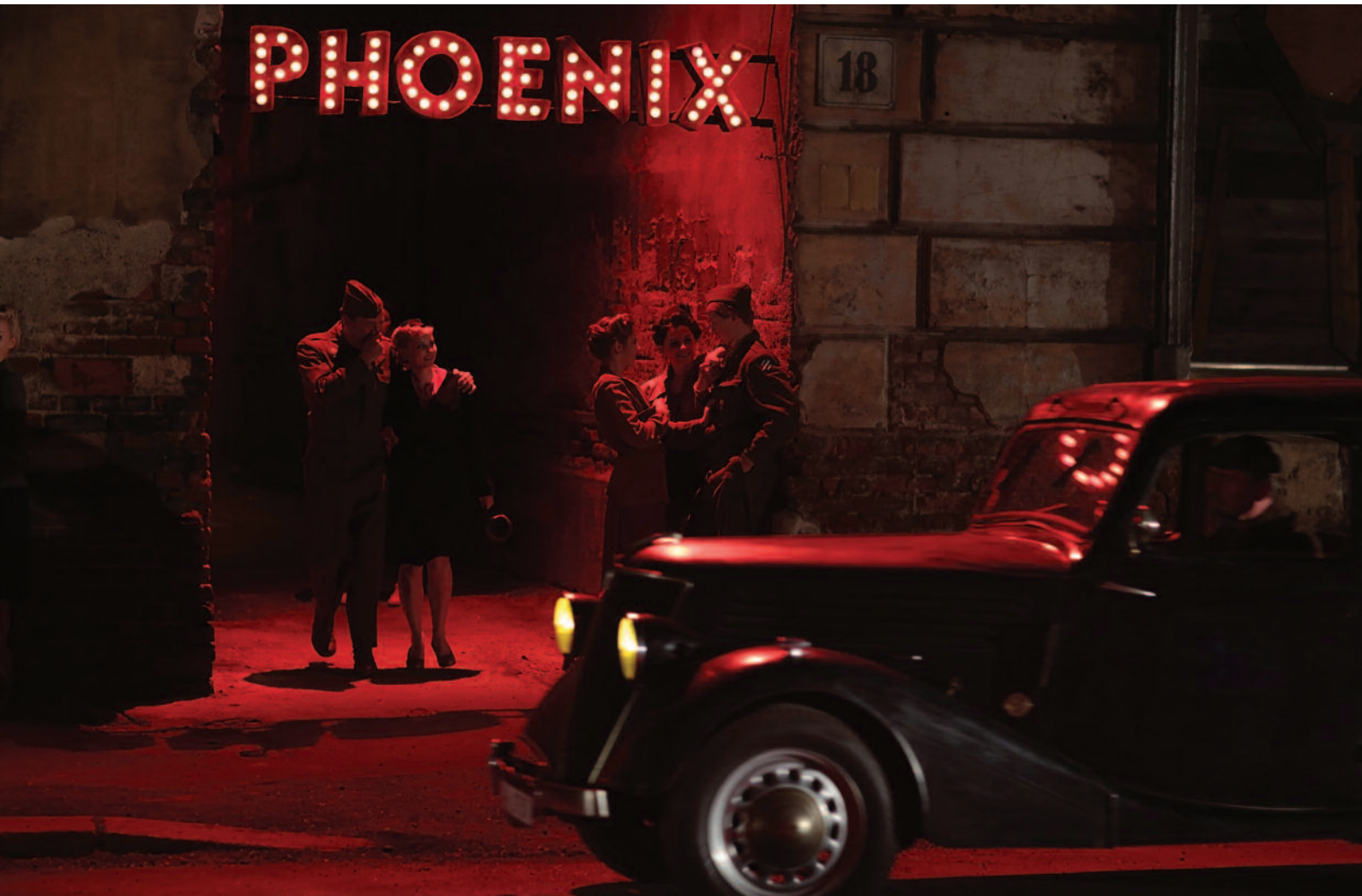
Phoenix (r. Ch. Petzold; DE, PL; 2014), Výberová podpora kinodistribúcie, ASFK