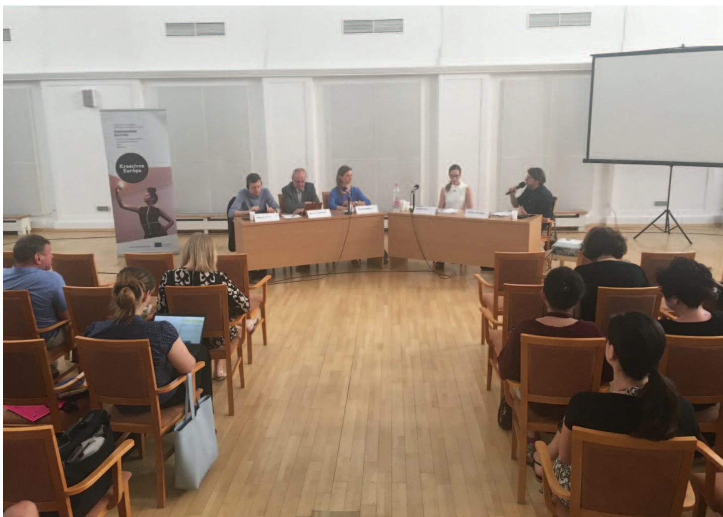
Konferencia Verejne o verejných zdrojoch pre kultúru