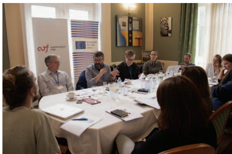
DOX IN VITRO 2017