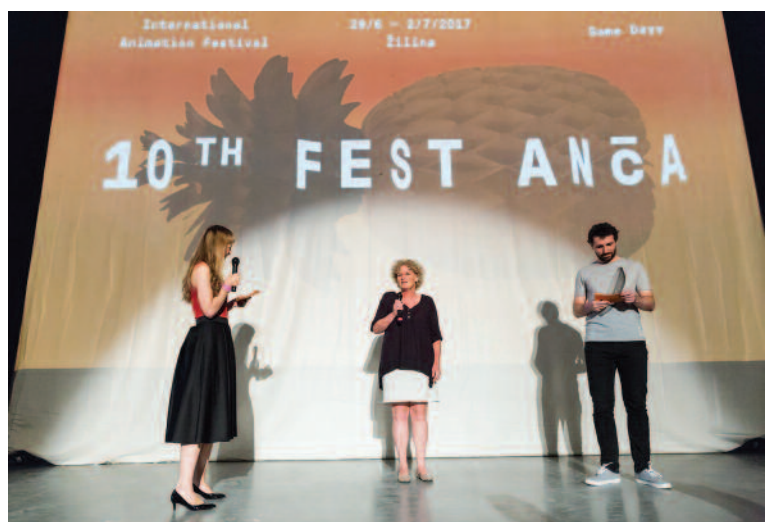
Festival animovaných filmov Fest Anča