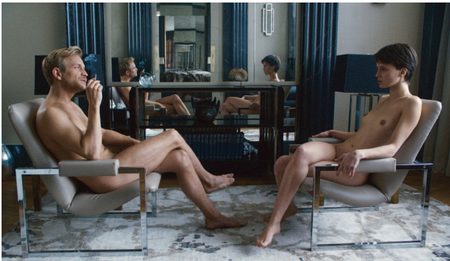
L'amant double (r. Francois Ozon; FR/BE; 2017), Výberová podpora kinodistribúcie, ASFK