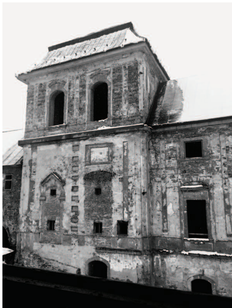
V Jelšave aktuálne prebieha náročný proces obnovy ruiny kaštieľa Coburgovcov za použitia verejných dotácií