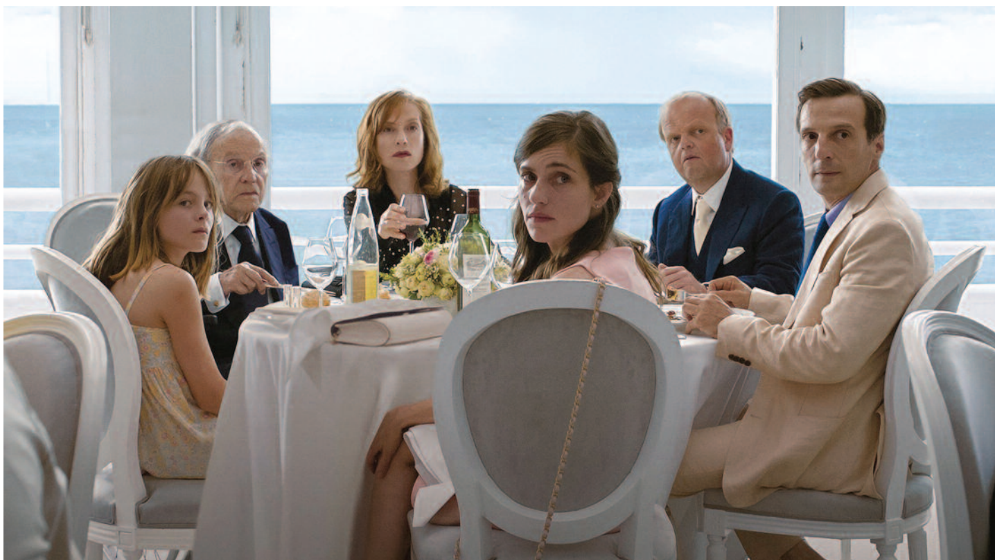
Happy End (r. Michael Haneke; FR/DE/AT; 2017).