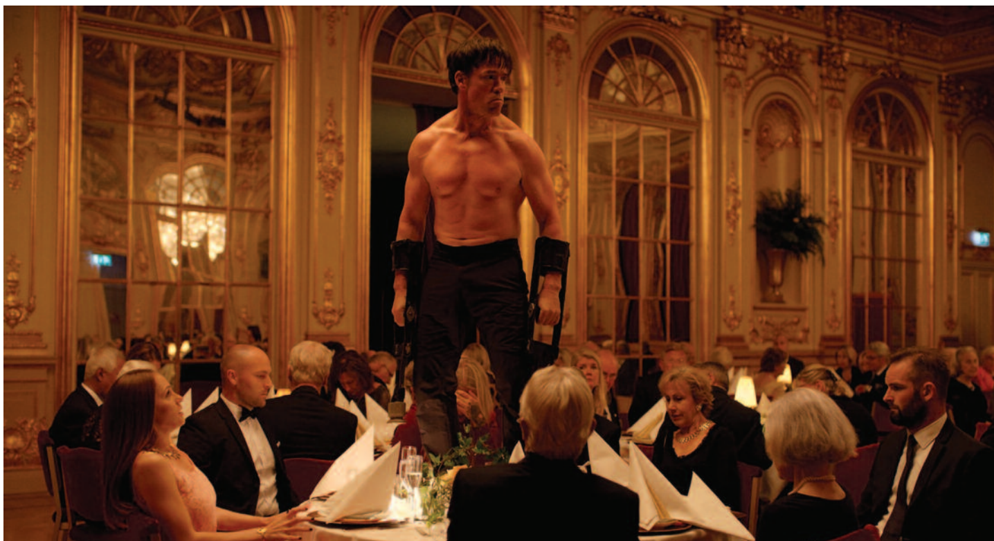
The Square (r. Ruben Östlund; SE/DE/FR/DK; 2017). Výberová podpora kinodistribúcie, Film Europe