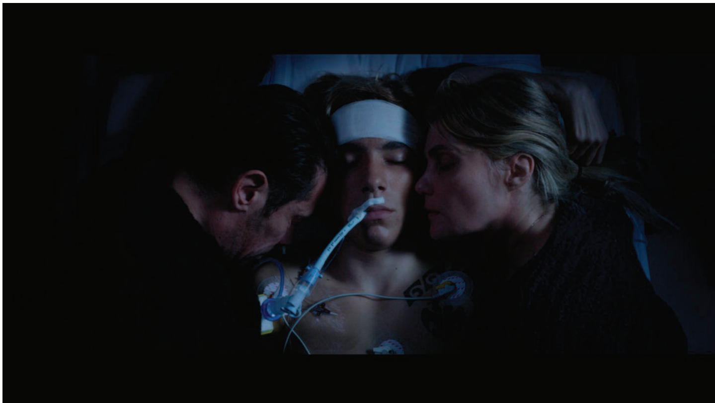
Réparer les vivants (r. Katell Quillévéré; FR/BE; 2016), Výberová podpora kinodistribúcie, ASFK