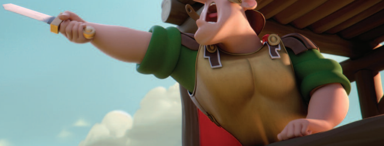
Asterix a tajomstvo čarovného nápoja , r. Alexandre Astier, Louis Clichy, Francúzsko, 2018, EACEA/27/2018 Podpora nadnárodnej distribúcie európskych filmov – automatická podpora, , Magic Box Slovakia