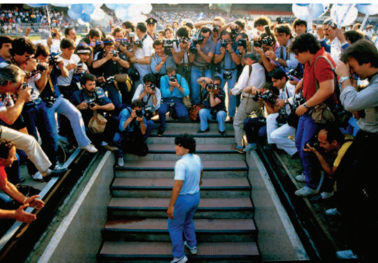
Diego Maradona , r. Asif Kapadia, Veľká Británia, 2019, EACEA/27/2018 Podpora nadnárodnej distribúcie európskych filmov – automatická podpora, Continental film