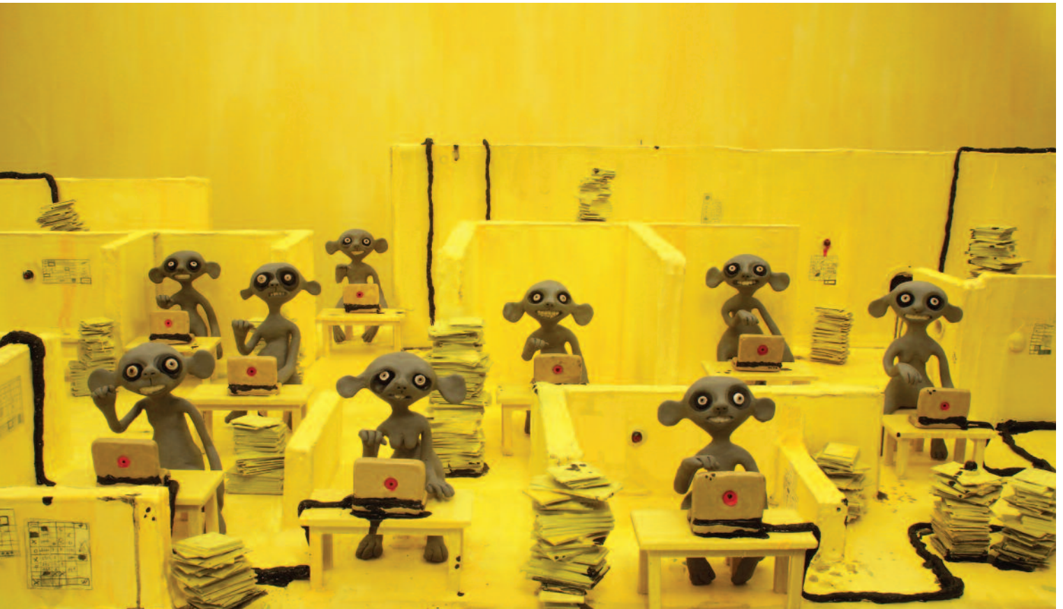
Peniaze a šťastie , r. Ana Nedeljković a Nikola Majdak jr. Srbsko/Slovinsko/Slovensko, EACEA/18/2019 – Podpora vývoja balíkov projektov, BFilm