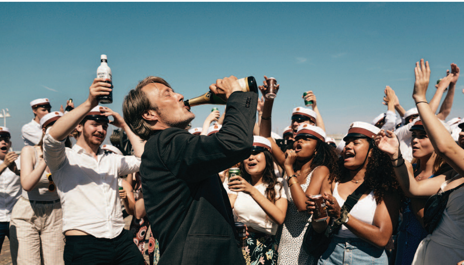
Chlast , r. Thomas Vinterberg, Dánsko, 2020, EACEA/21/2019 Podpora nadnárodnej distribúcie európskych filmov – výberová podpora, Film Europe