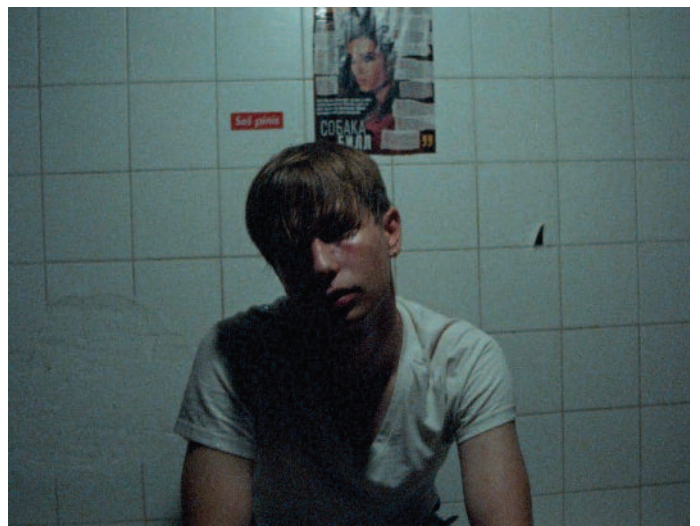
Velvet Generation , (predchádzajúci názov Vogue), r. Ivana Hucíková, Slovensko, EACEA 18/2019 – Podpora vývoja balíkov projektov, nutprodukcia