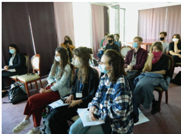
DOX IN VITRO 2020