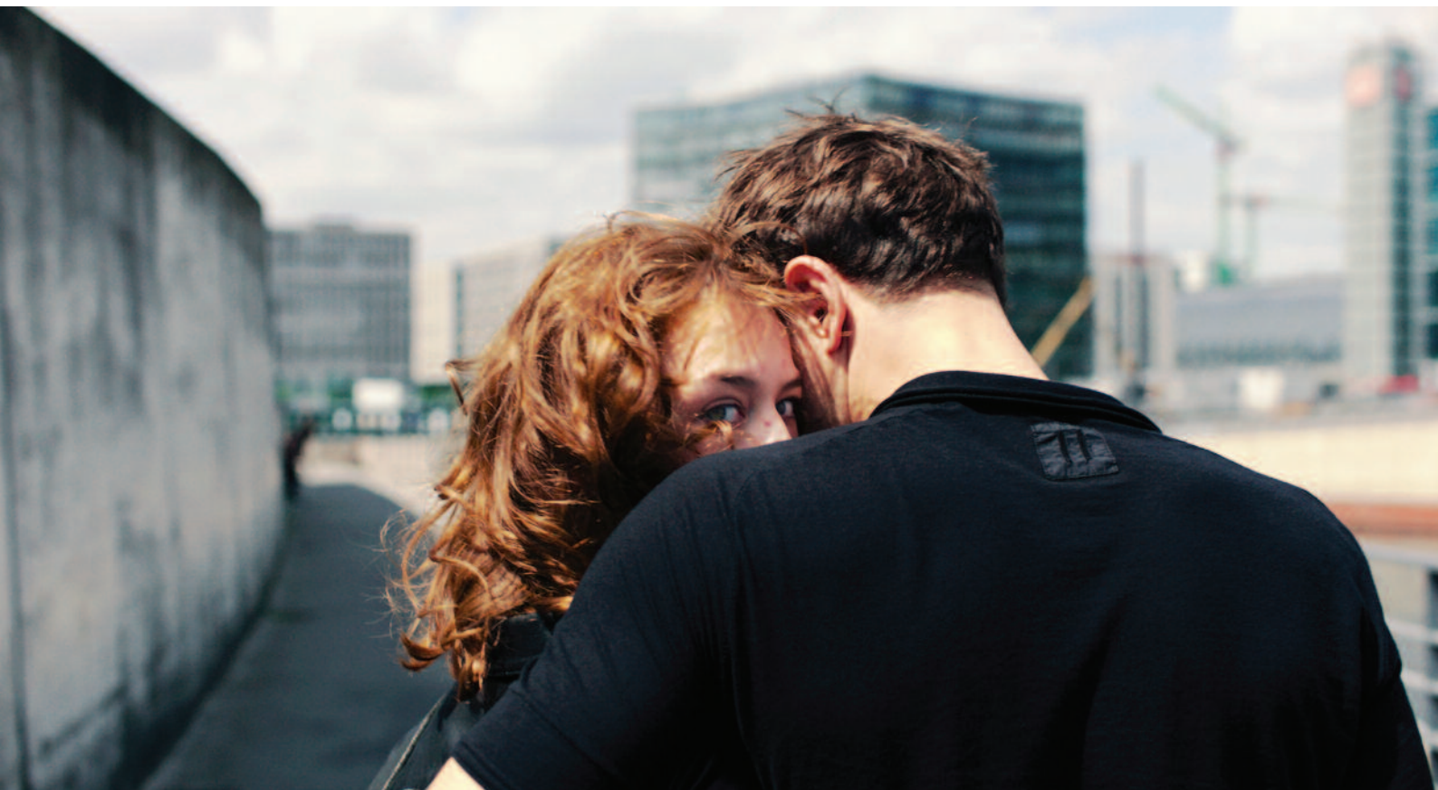
Undine , r. Christian Petzold, Francúzsko/Nemecko, 2020, EACEA/21/2019 Podpora nadnárodnej distribúcie európskych filmov – výberová podpora, Film Europe