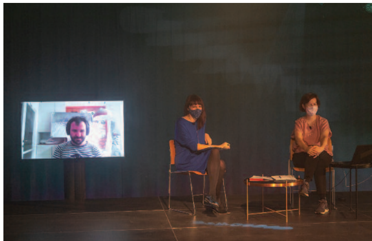
Festival Nasuti, panelová diskusia Green Funding