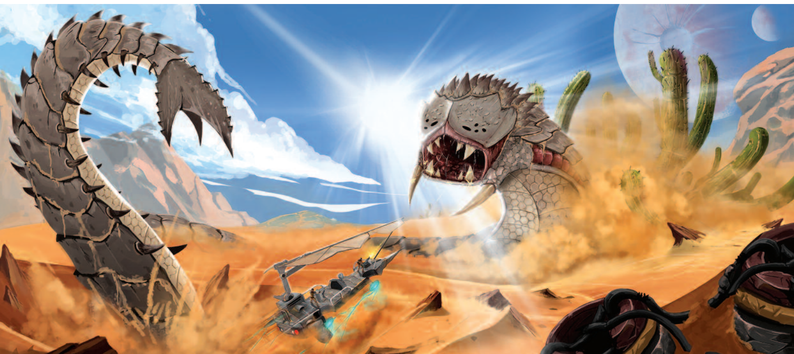
Videohra Sinum VR , spoločnosť Fono Labs, Video Games and Immersive content development