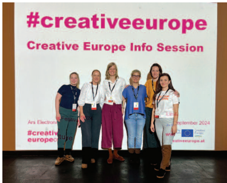
ARS ELECTRONICA, festival Linz, Creative Europe infosession

Game Days – konferencia a festival herného priemyslu.