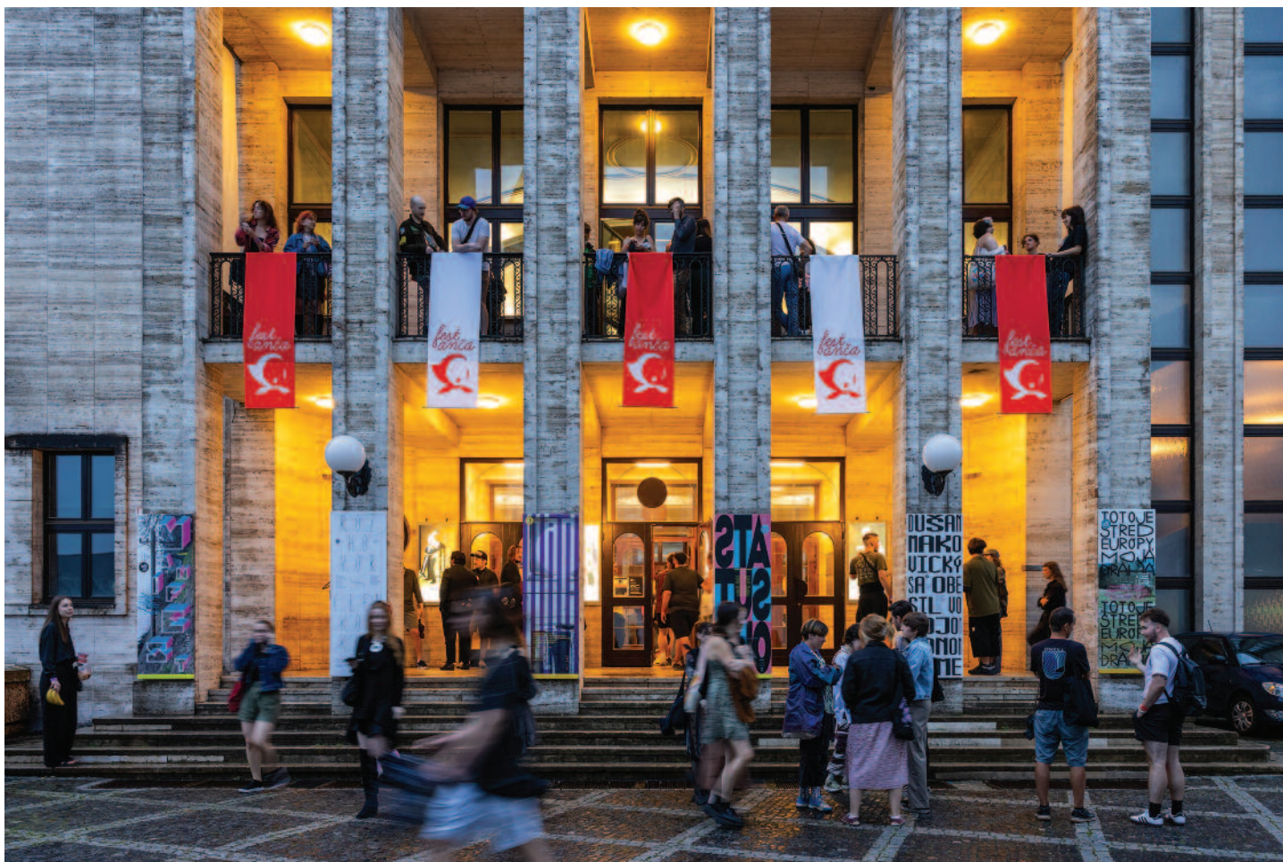
Fest Anča International Animation Festival, Festival network