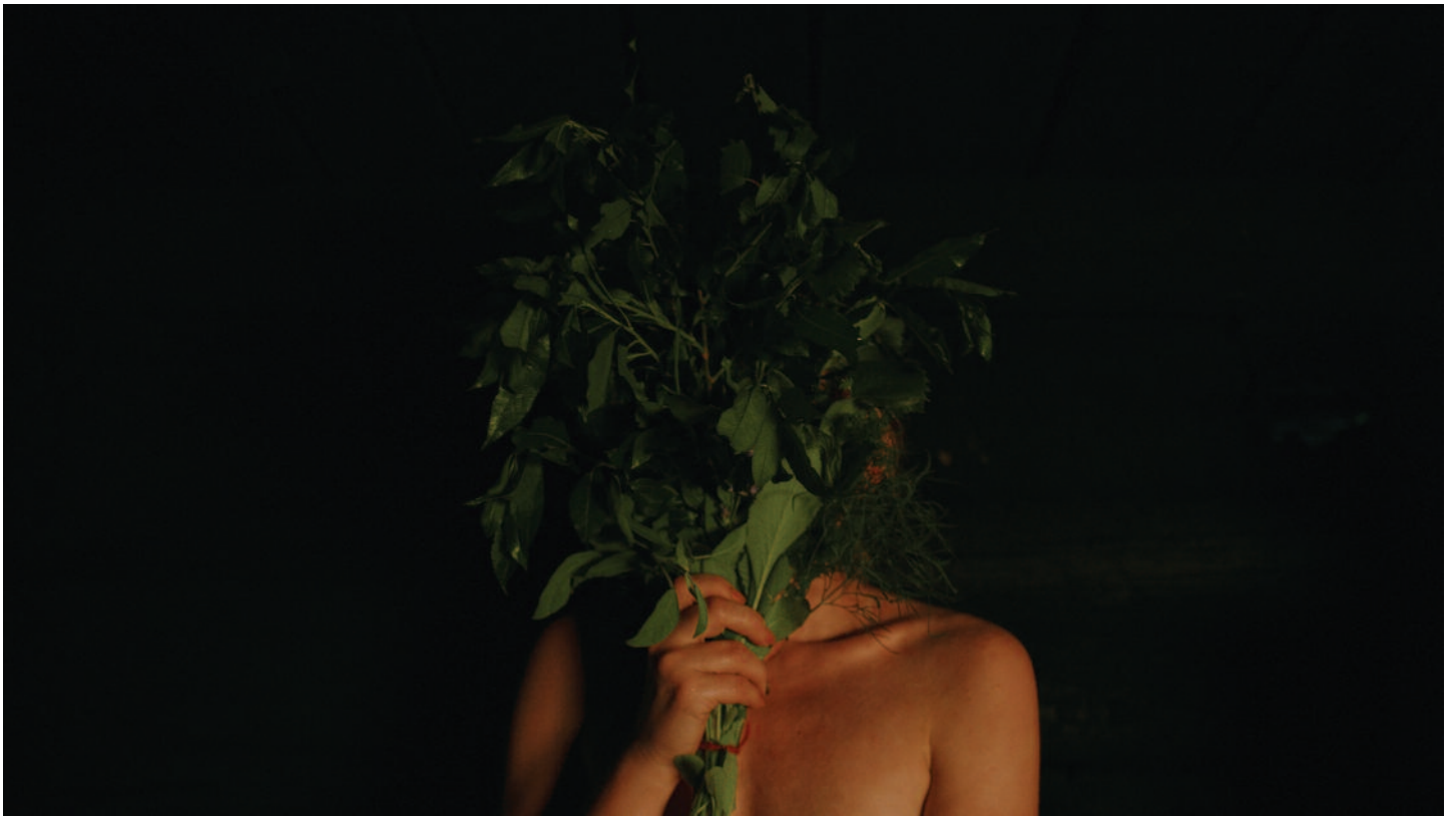
Sestry z dymovej sauny (A. Hints, EE, FR, IS, 2023), European film distribution, Filmtopia