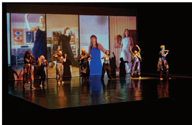
Perform Europe – Diera do sveta