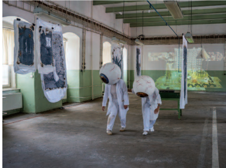
Zmina rebuilding Ukraine, Tabačka Kulturfabrik, projekt Reimagining - Realities

> Rok 2024 priniesol nové príležitosti na podporu medzinárodných kultúrnych projektov, pričom viaceré aktivity sa v nasledujúcich rokoch uskutočnia aj na Slovensku. Slovenské organizácie boli úspešné v rámci výzvy Projekty európskej spolupráce (kód výzvy: CREA-CULT-2024-COOP). Spolu získali finančné príspevky na realizáciu projektov pokrývajúcich široké spektrum umeleckých a