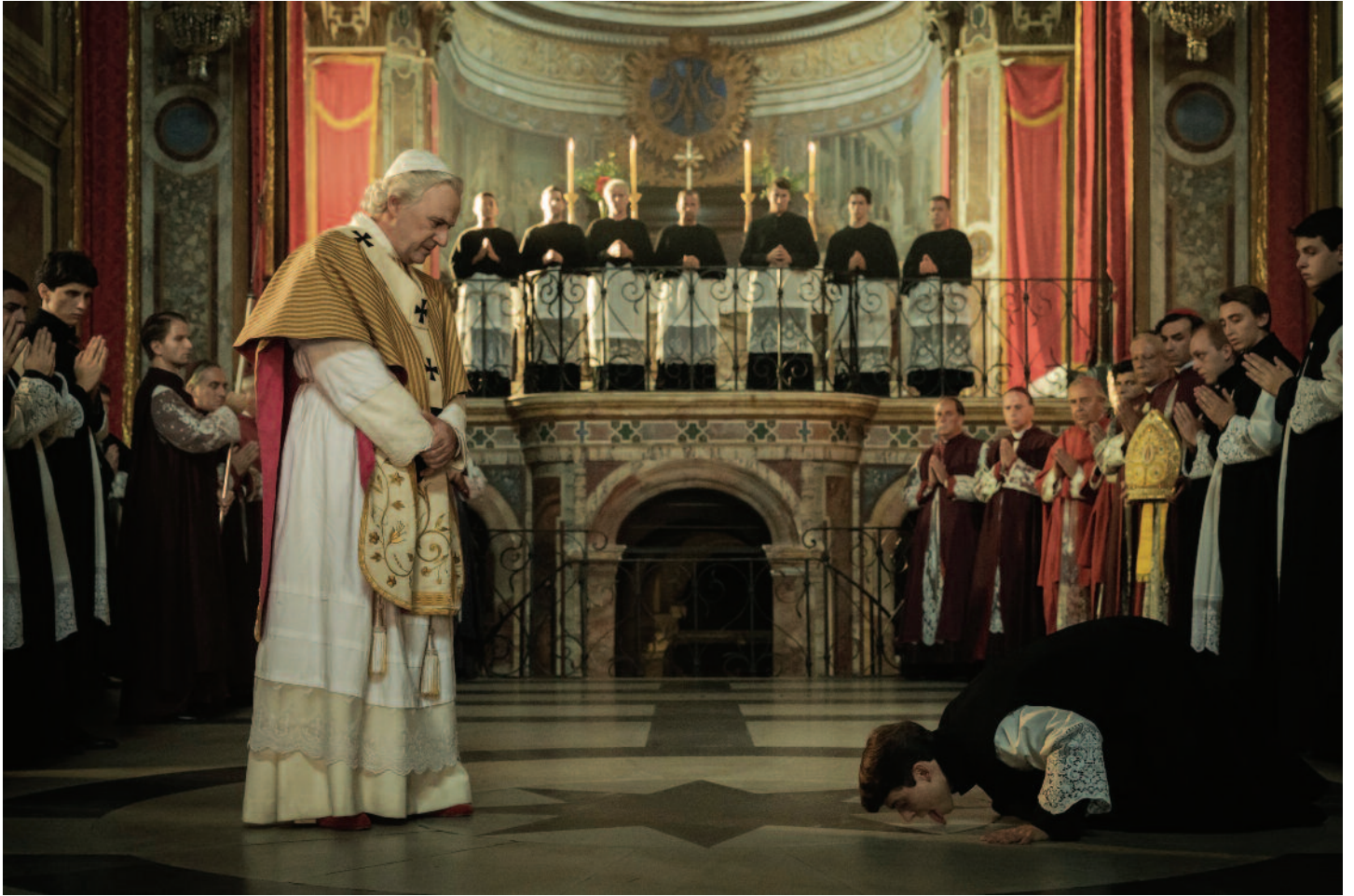
Pápežov zákon (M. Bellocchio, IT, FR, DE, 2023), European film distribution, ASFK