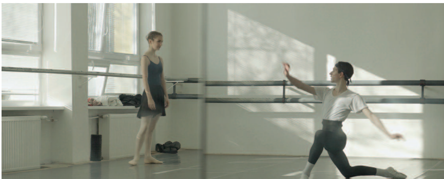
Pryvit Europa, spoločnosť Guča, European co-development