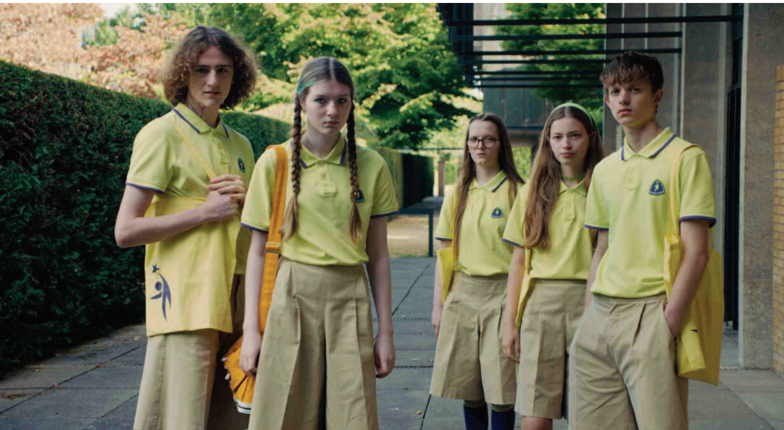
Club zero (J. Hausner, AT, GB, DE, DK, FR, 2023), European film distribution, ASFK