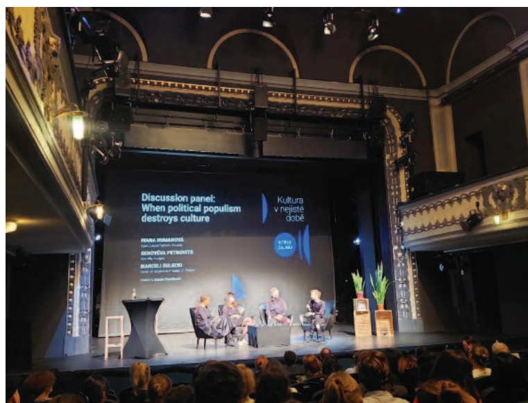
Střed zájmu, medzinárodná konferencia Praha